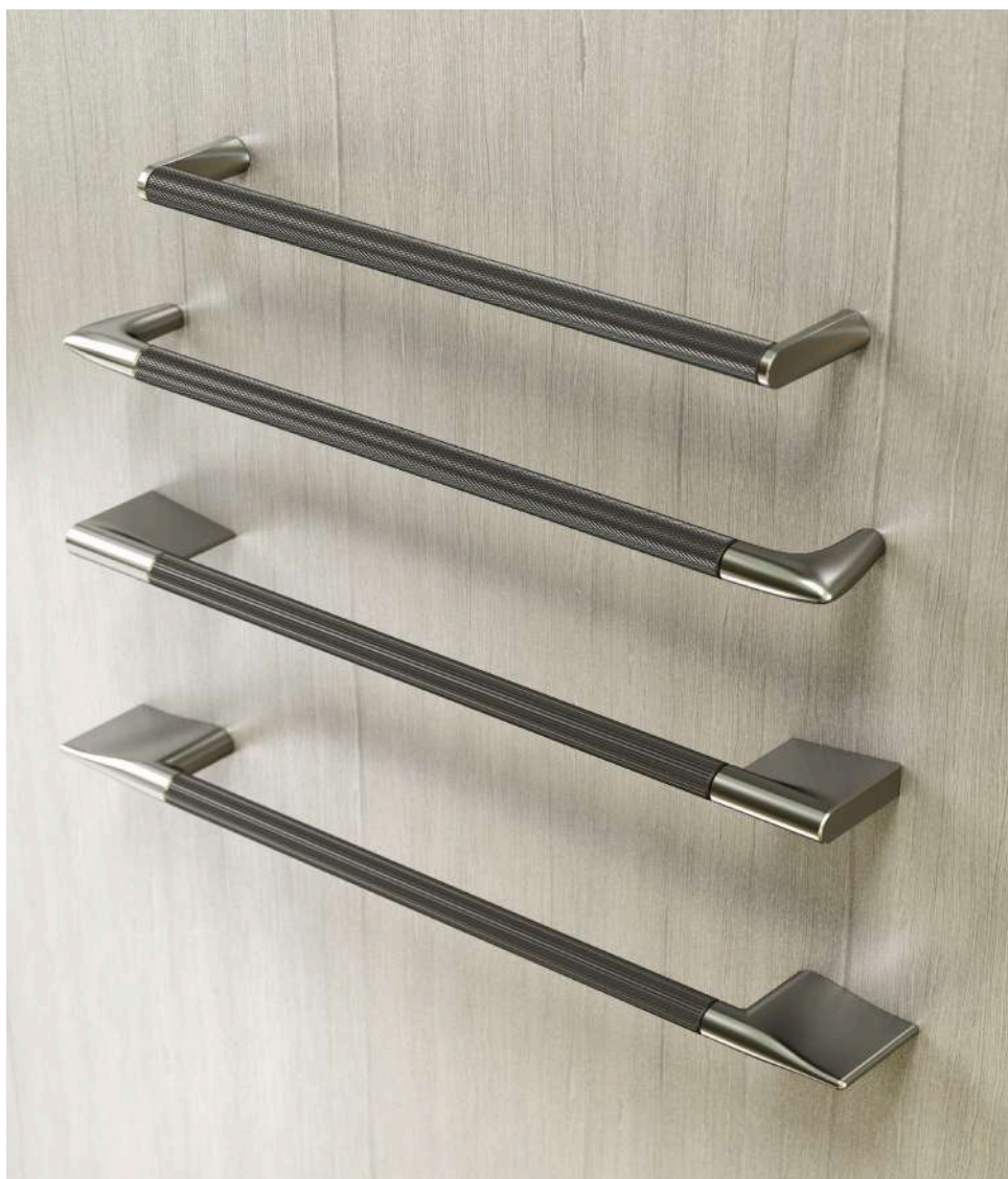
KOLEKCJA UCHWYTÓW PRĘTOWYCH